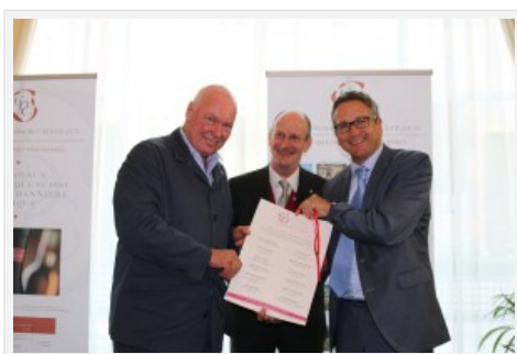
A Losanna Jean-Claude Biver riceve il Guillon d'Or