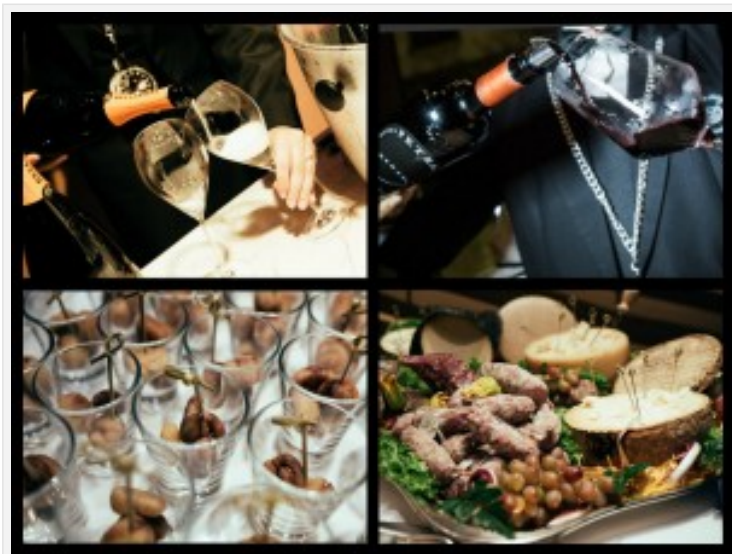
Da Pisa-Rolex spumante e castagne tiepide e un rosso profumato con formaggi e salumi

Grappoli d'uva o altre decorazioni in passato hanno completato la scenografia della via, ma quest'anno si è scelto la sobrietà. Nelle boutiques di Jaeger-LeCoultre, Panerai, Breguet, Omega, Montblanc, tutte sulla sinistra partendo da San Babila, gli invitati hanno brindato alle novità rispettivamente, con Champagne Louis Roederer, Brunello Le Lucère, Champagne Pol Roger, Barolo Oddero; doppia offerta da Montblanc con Verdicchio Dominè di Pievalta e Barone Pizzini Franciacorta Bagnadore. Attraversando la via, da Pisa-Rolex sono stati offerti spumante Bellavista e rosso Petra della Cantina che appartiene al GruppoTerra Moretti. Sfiziosi snack da tutti, ma un applauso particolare lo merita Pisa che ha scelto Peck, con una serie di rustici prodotti nostrani.