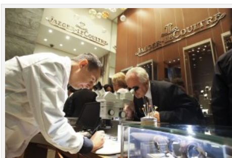
Il movimento al microscopio da Jaeger-LeCoultre

Da Jaeger-LeCoultre non sono state previste foto di etichette, ma vale la pena di ricordare che un loro tecnico ha mostrato i segreti degli orologi agli ospiti, distraendoli sicuramente dallo champagne.