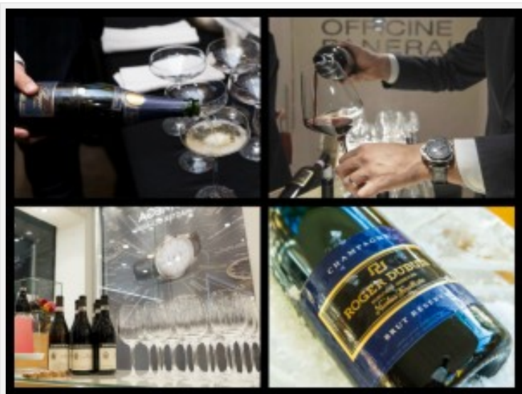
In alto brindisi da Breguet e Panerai, qui Omega e l'etichetta scelta da Roger Dubuis

Da Jaeger-LeCoultre non sono state previste foto di etichette, ma vale la pena di ricordare che un loro tecnico ha mostrato i segreti degli orologi agli ospiti, distraendoli sicuramente dallo champagne.